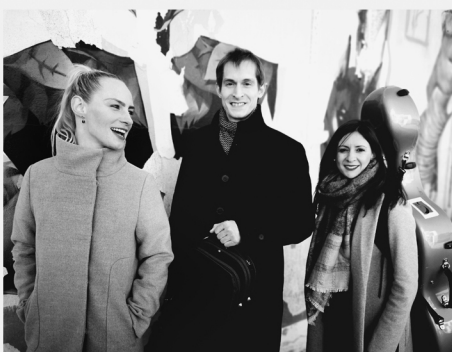
Sirius Piano Trio